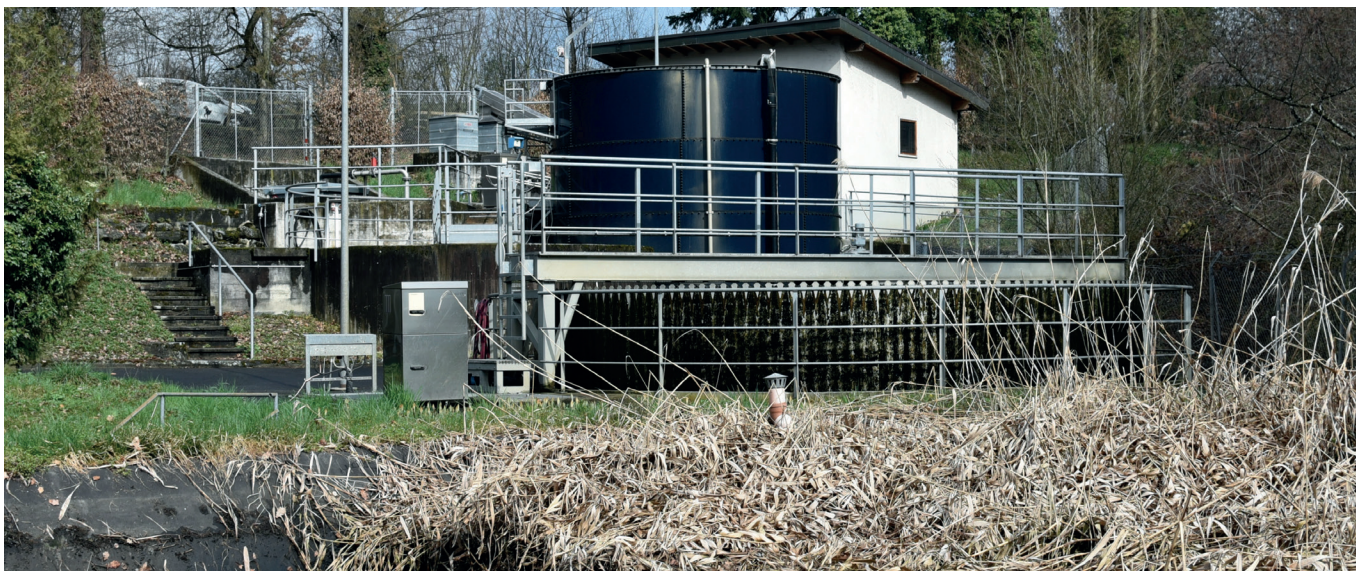
STEP de Lully - Lussy.

Vous trouverez le nouveau règlement sur l'évacuation et l'épuration des eaux sur le site web de la commune sous « Administration / Règlements communaux ».