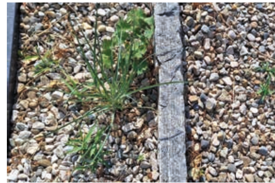
Voici à quoi ressemble cet envahisseur.