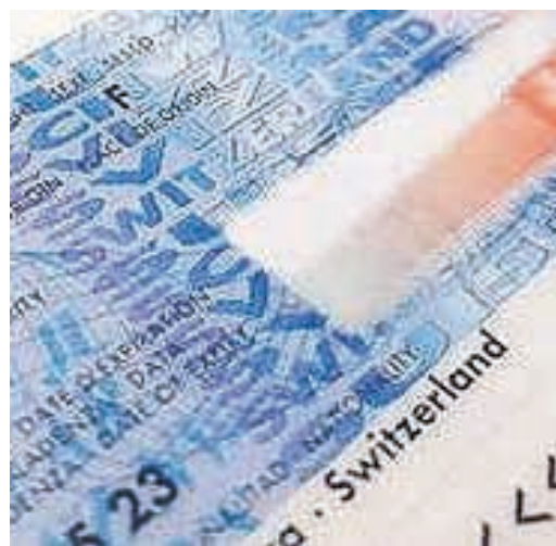
Une carte d'identité valable pour voyager, c'est mieux.