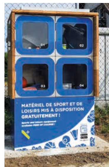
Les Box Up se trouvent à côté de la poste et du terrain de foot.