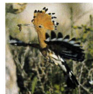
Huppe fasciée Pose de nichoirs dans les vignes et vergers