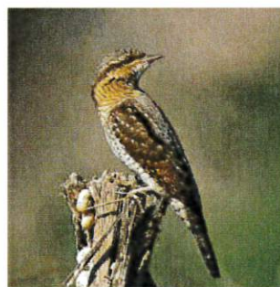
Torcol fourmilier Pose de nichoirs Fauche alternée