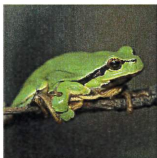
Rainette verte Mares temporaires Haies basses