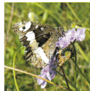
Silène Faible pression de pâture Maintien des refus Fauche tardive