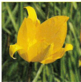
Tulipe sauvage Vignes enherbées Espacement des fauches