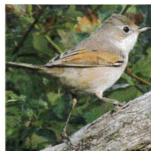
Fauvette grissette Entretien des haies Favoriser les épineux Jachères