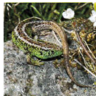
Lézard des souches Abris: tas de bois, haies Étagement des lisières Fauche tardive