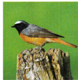
Rougequeue à front blanc Pose de nichoirs Fauche alternée